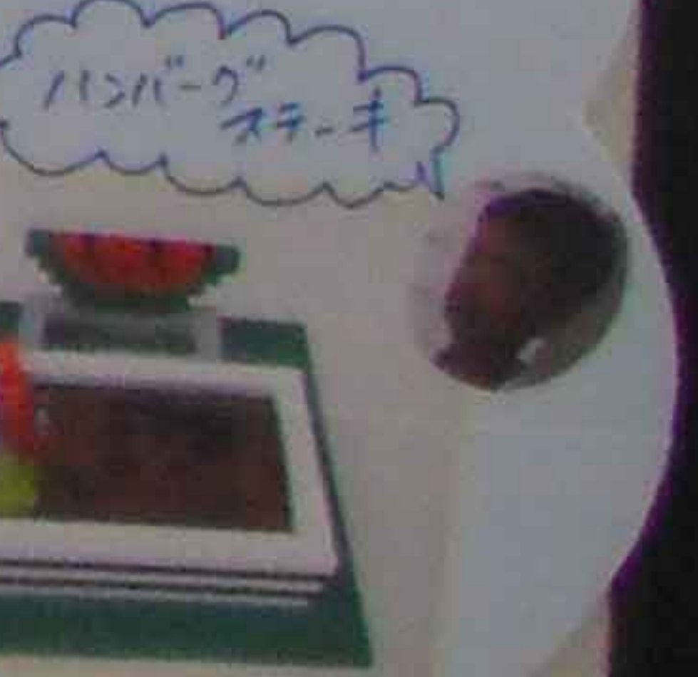
ハンバーグ ステーキ