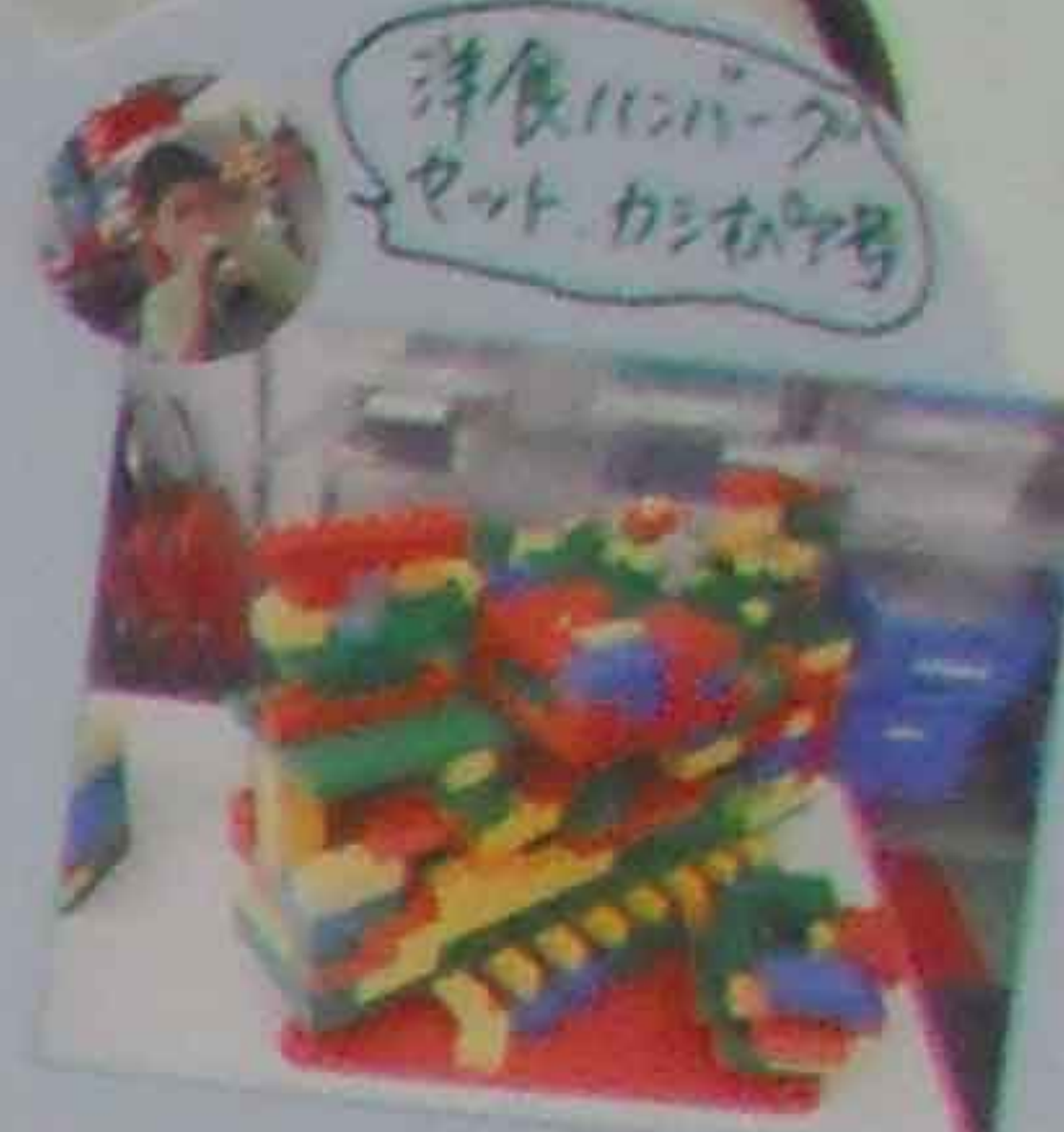
洋食ハンバーグ セット、カシオパザ