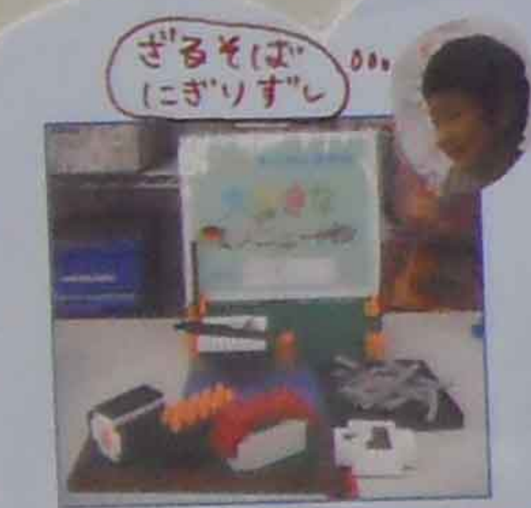
ざるそば にぎりずし