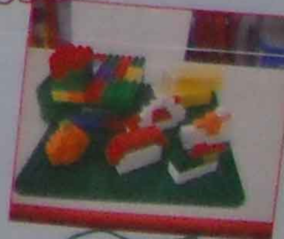
おにぎり、おにぎり ハンバーグ