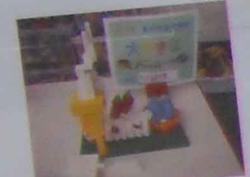
ケーキ ソフトクリーム ワッパン