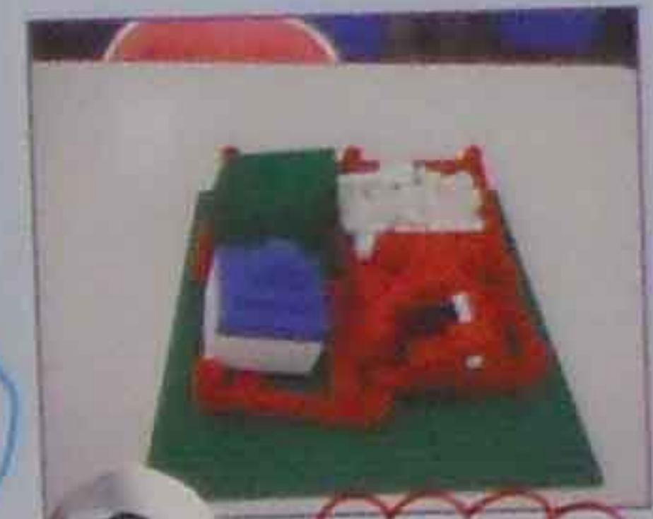
ピロマン、ごはん アイス、お肉