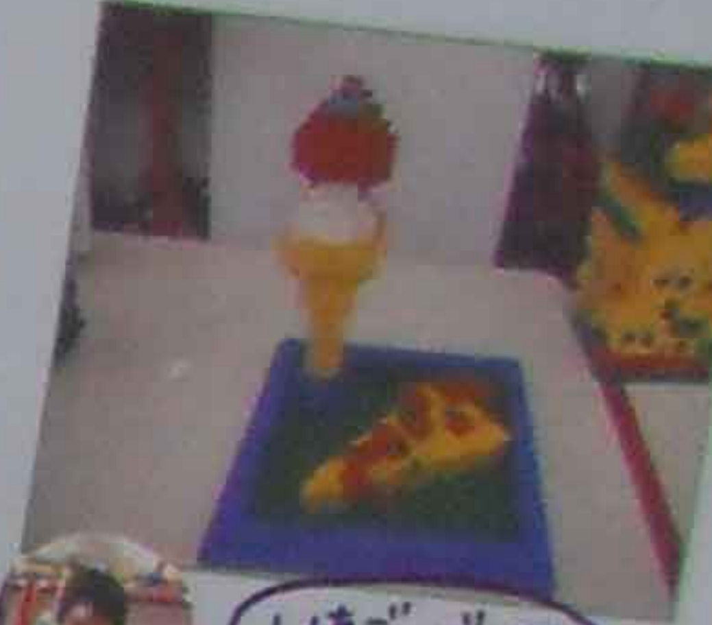
いちご、パニタ タラシアイス、 トナリ、パニタ ピザ