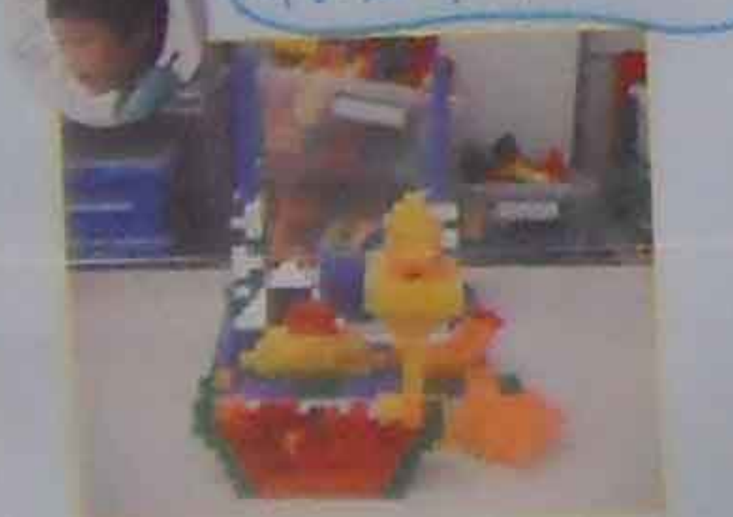
スイト、ミヤベット、エビフライ やきいん、おにぎり、お肉