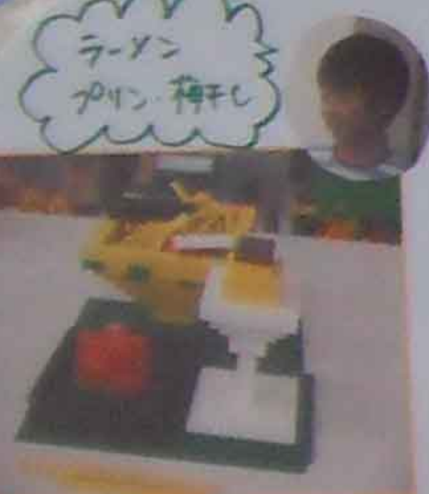
ラーメン うどん、梅干し