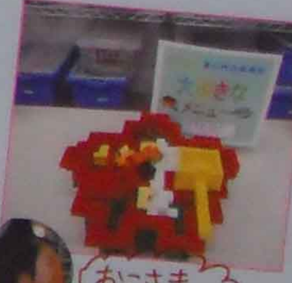
おにさま ホロケカレー