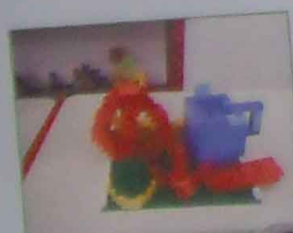
りんご、大根 おろし、タコさん カレー