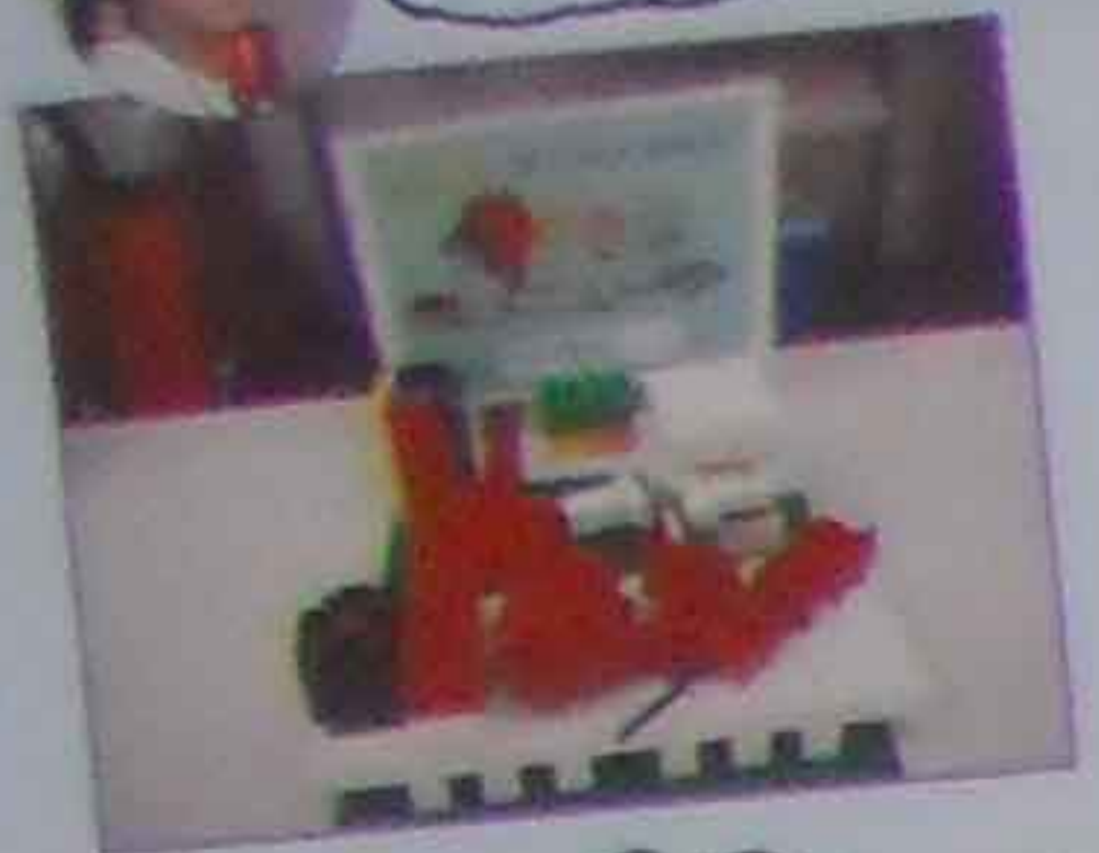
しほい多保セット すし、やきとり、フライドチキン ハンバーガー