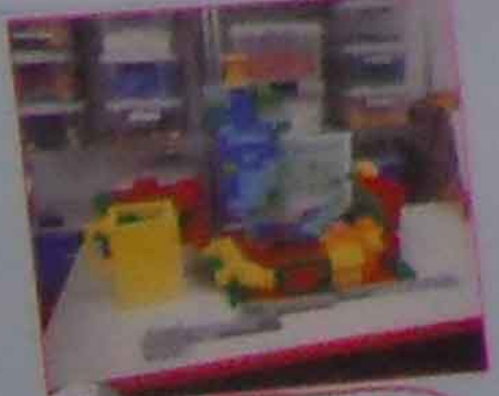
おにぎり、スイカ りんご、いちご